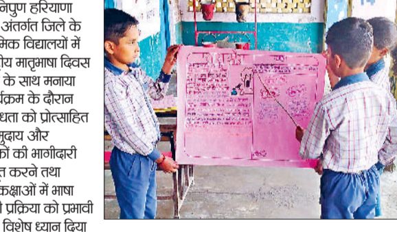
झज्जर। निपुण हरियाणा मिशन के अंतर्गत दित्तो के सभी प्राथमिक विद्यालयों में अंतरराष्ट्रीय मातृभाषा दिवस हर्षोल्लास के साथ मनाया गया।