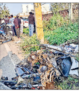
हादसे के बाद क्षतिग्रस्त वाहन।

■ सड़क के दूसरी ओर ड्रिवाइडर फांदकर नाले में अटकी कार, आरोपी परिवार मौके से फरार