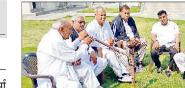
झज्जर। मामले को लेकर चर्चा करते हुए सरपंच एसोसिएशन के उपाधिकारी।

■ जींद में पूर्व सरपंच के साथ विवाद के मामले ने पकड़ा तूल