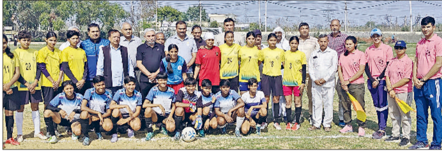
बहादुरगढ़। अतिथियों व कोचों के साथ टीम की खिलाड़ी।