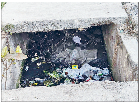
बहादुरगढ़। नागरिक अस्पताल के गेट पर खुला नाला।