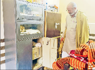
बहादुरगढ़। चोरी के बाद अलमारी दिखाते मालिक।

■ गहनों की अलमारी वाले कमरे में अकेला सो रहा था मुखिया, लघुशंका के लिए उठा तो पीछे से घुसा चोर ■ चोर दीवार फांदकर खाली प्लाट के रास्ते से भागा, एक बंद पड़े मकान में भी किया चोरी का प्रयास